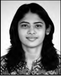
ચિ. ડૉ. આરોહી BDS